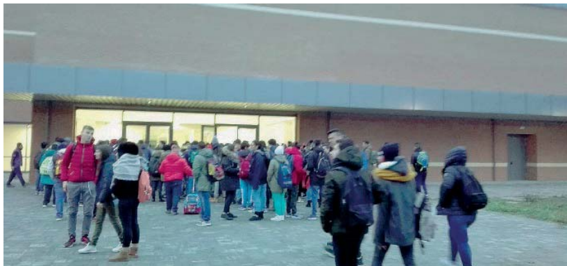
Data storica Gli studenti dell'istituto Solari ieri mattina sono rientrati a scuola dopo le vacanze natalizie nella nuova sede dell'«agraria», in via Croce rossa. Giudizi tutti positivi.

Ieri prima campanella in via Croce rossa: 18 aule e 7 laboratori per 400 studenti