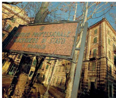
Scuola L'ingresso dell'istituto Magnaghi di Salsomaggiore.

della Fondazione orientare i giovani verso le professioni tecnico-scientifiche, rispondere alle esigenze di innovazione scientifica, tecnologica e organizzativa delle imprese, concorrendo allo sviluppo economico del territorio; assicurare l'offerta di tecnici superiori in coerenza ai fabbisogni formativi e occupazionali del settore alimentare; realizzare attività di aggiornamento destinate a docenti e formatori di area tecnico-scientifica; partecipare ad iniziative di interesse scientifico a livello nazionale ed internazionale. ♦ A.S.