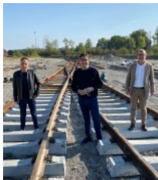
INTERPORTO L'assessore Corsini (al centro) a Parma.

mazione dei sistemi di mobilità delle merci, non solo a livello regionale e locale, ma anche nel panorama nazionale ed internazionale. «Ringrazio l'assessore Corsini e la Regione Emilia Romagna - ha detto il presidente di Cepim Gianpaolo Serpagli - per l'attenzione alla nostra realtà, insieme abbiamo visionato i la-