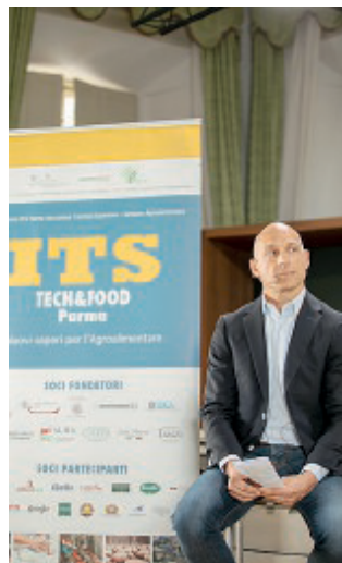
ITS FOOD&&TECH Il presidente della Fondazione Ambanelli.